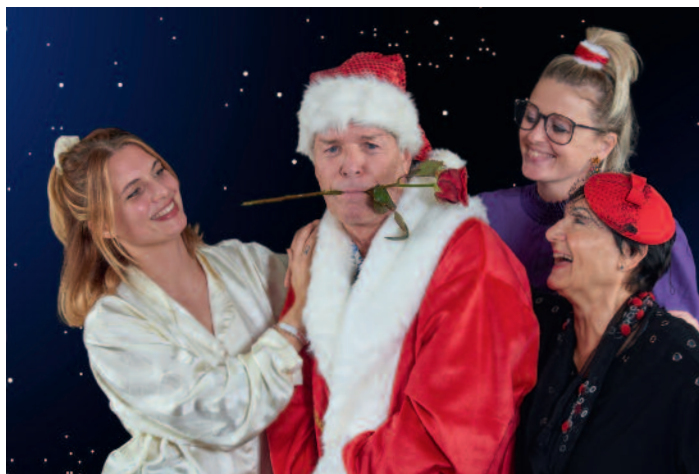
Der Neurosenkavalier: Ein Stück des Bremer Union Theaters

geschlossen, fanden es fast schon richtig schade, dass unser gemeinsamer Törn nach fast drei Stunden schon wieder vorbei war.